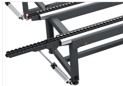
Table à rouleaux

Module Bench peut s'étendre de 1 300 mm à 2 500 mm et peut être réglé dans n'importe quelle position au moyen d'un levier de serrage, ce qui lui confère une grande polyvalence. Il est également possible de positionner manuellement la traverse centrale pour l'usinage de petits cadres.