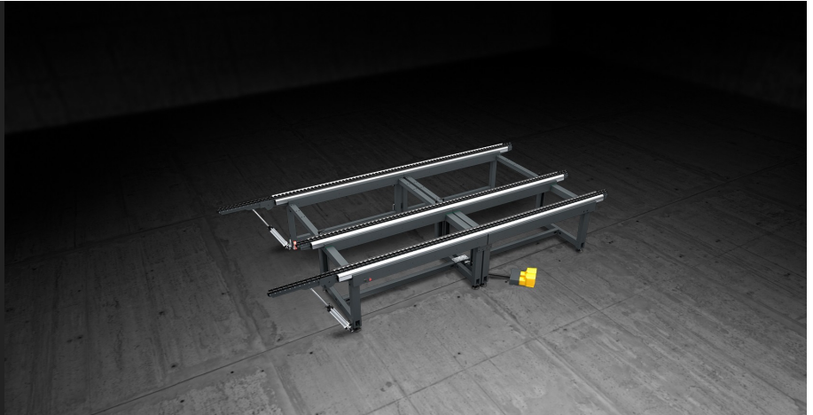
Table modulaire extensible de grandes dimensions conçue pour le montage de menuiseries et de cadres de murs-rideaux. Equipée de 3 surfaces de travail distinctes: l'une en PVC souple pour les opérations de montage, l'une en PVC dur antifriction pour la rotation et un chemin d'amenage pour le déplacement en ligne.