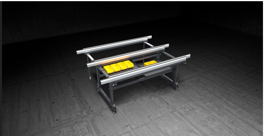
Table conçue pour n'importe quelle opération d'assemblage des menuiseries. Les plans coulissants extensibles permettent d'usiner des cadres de n'importe quelle dimension et des structures particulièrement encombrantes en toute sécurité.