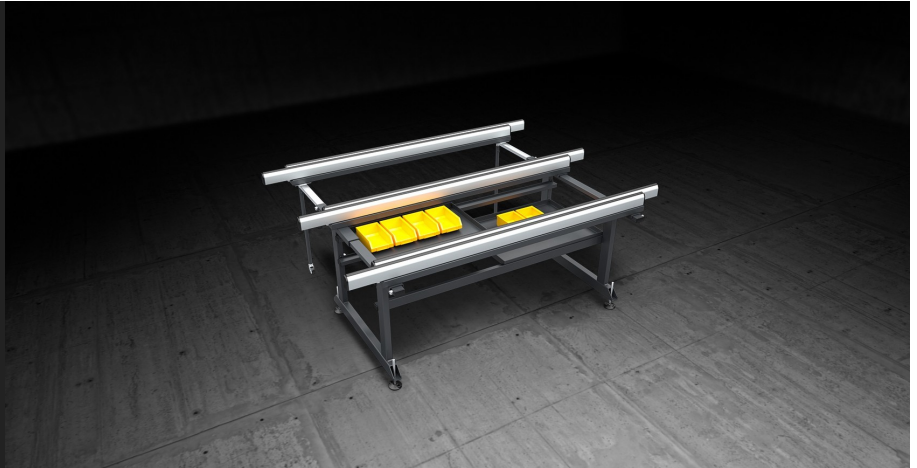
Table conçue pour n'importe quelle opération d'assemblage des menuiseries. Les plans coulissants extensibles permettent d'usiner des cadres de n'importe quelle dimension et des structures particulièrement encombrantes en toute sécurité.