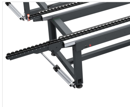
Table à rouleaux

Module Bench peut s'étendre de 1 300 mm à 2 500 mm et peut être réglé dans n'importe quelle position au moyen d'un levier de serrage, ce qui lui confère une grande polyvalence. Il est également possible de positionner manuellement la traverse centrale pour l'usinage de petits cadres.