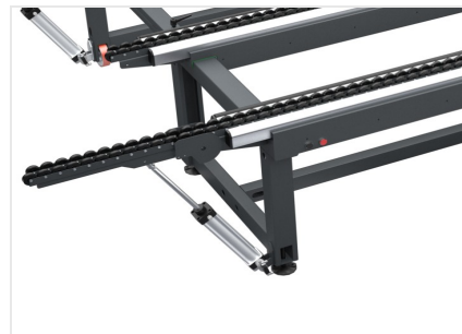
Table à rouleaux

Module Bench peut s'étendre de 1 300 mm à 2 500 mm et peut être réglé dans n'importe quelle position au moyen d'un levier de serrage, ce qui lui confère une grande polyvalence. Il est également possible de positionner manuellement la traverse centrale pour l'usinage de petits cadres.