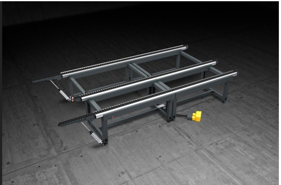
Table modulaire extensible de grandes dimensions conçue pour le montage de menuiseries et de cadres de murs-rideaux. Equipée de 3 surfaces de travail distinctes: l'une en PVC souple pour les opérations de montage, l'une en PVC dur antifriction pour la rotation et un chemin d'aménagement pour le déplacement en ligne.