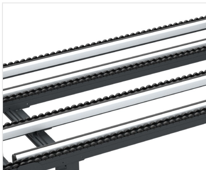
Table à rouleaux

Le plan de glissement est formé par des rangées de galets revêtus de PVC souple ; les deux extrémités du convoyeur à rouleau, à droite et à gauche, peuvent être basculées à l'aide de cylindres pneumatiques (en option).