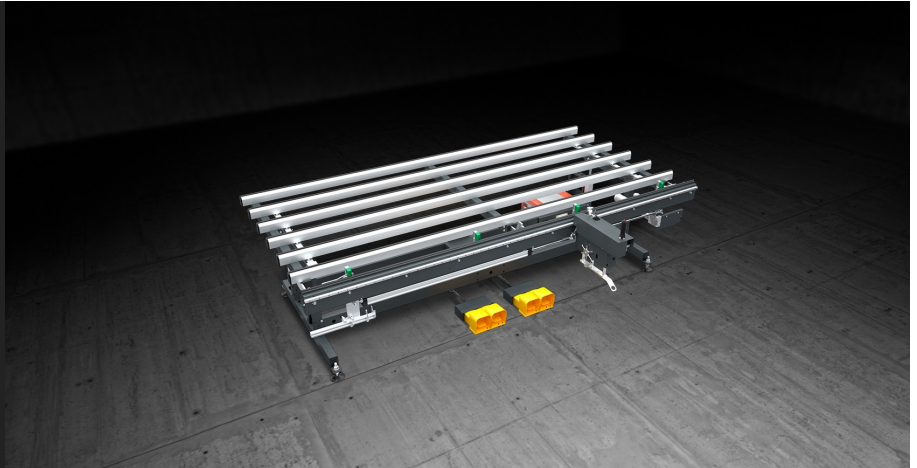
Table pour le montage de ferrures d'oscillo-battant sur ouvrants en aluminium, bois et PVC. Un système d'étaux escamotable assure le serrage de l'ouvrant. La table est équipée d'un système de vissage à alimentation automatique et, en option, d'un système pour le mesurage et la coupe des ferrures au moyen de la cisaille hydropneumatique.